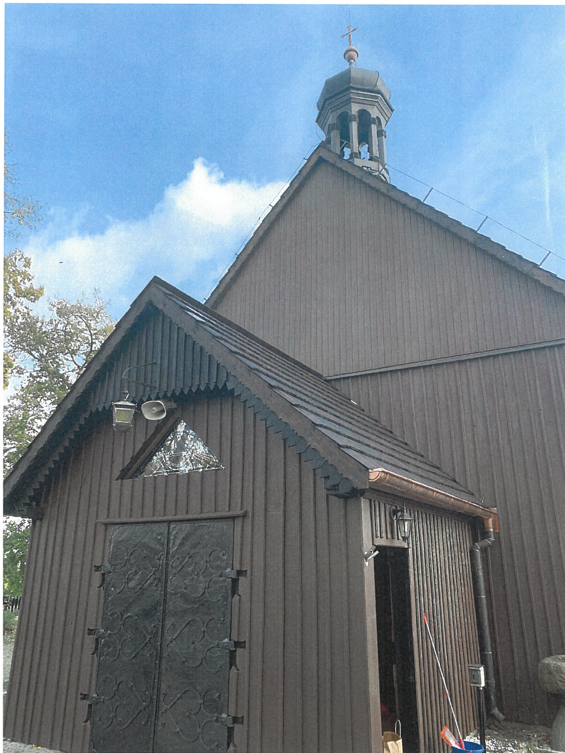
Inwentaryzacja – widok od strony zachodniej