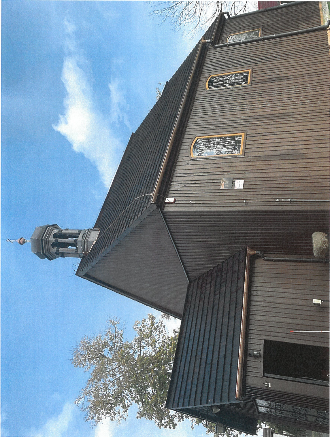
Inwentaryzacja - Widok od strony południowej