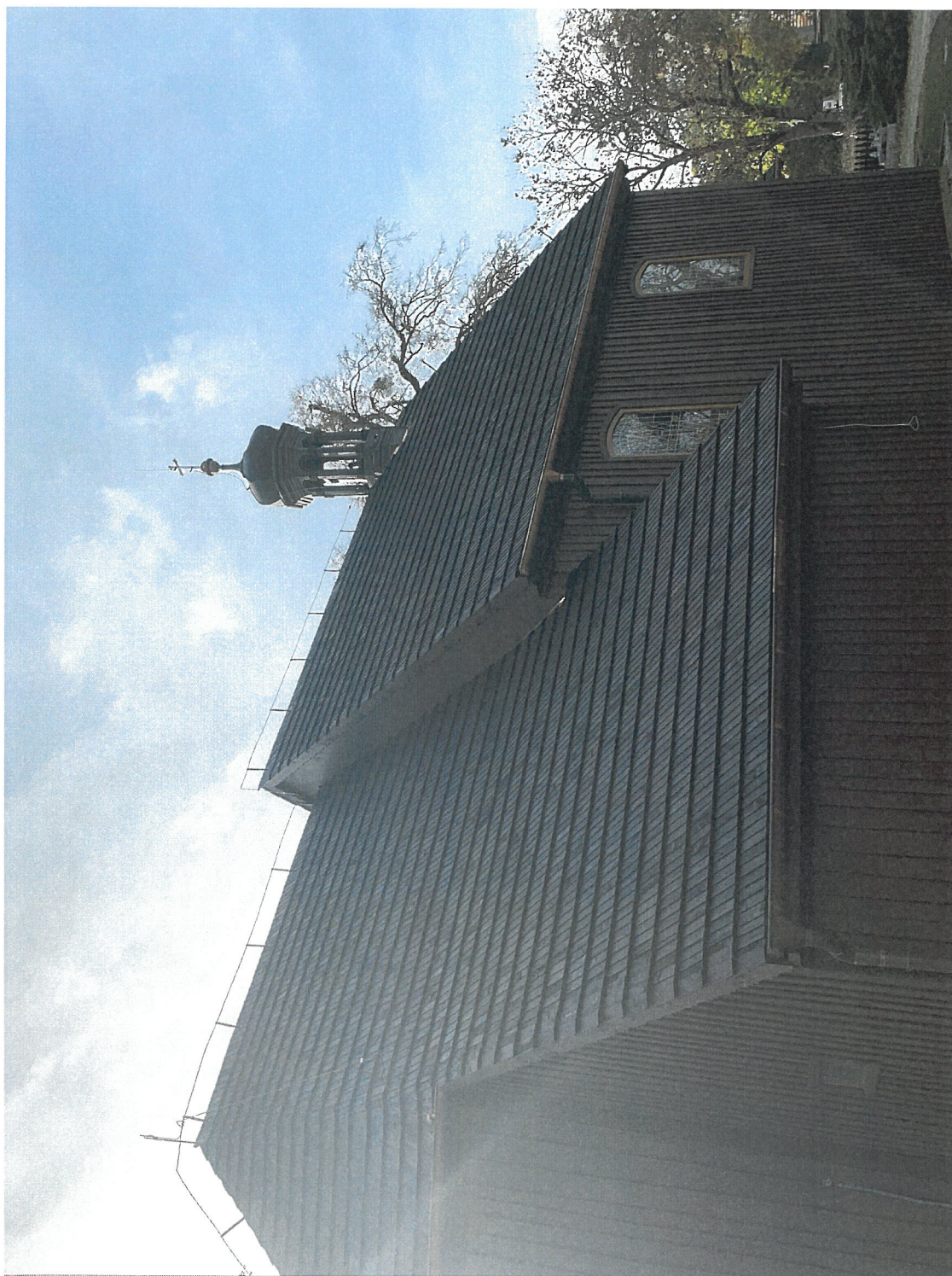
Inwentaryzacja – widok od strony północnej