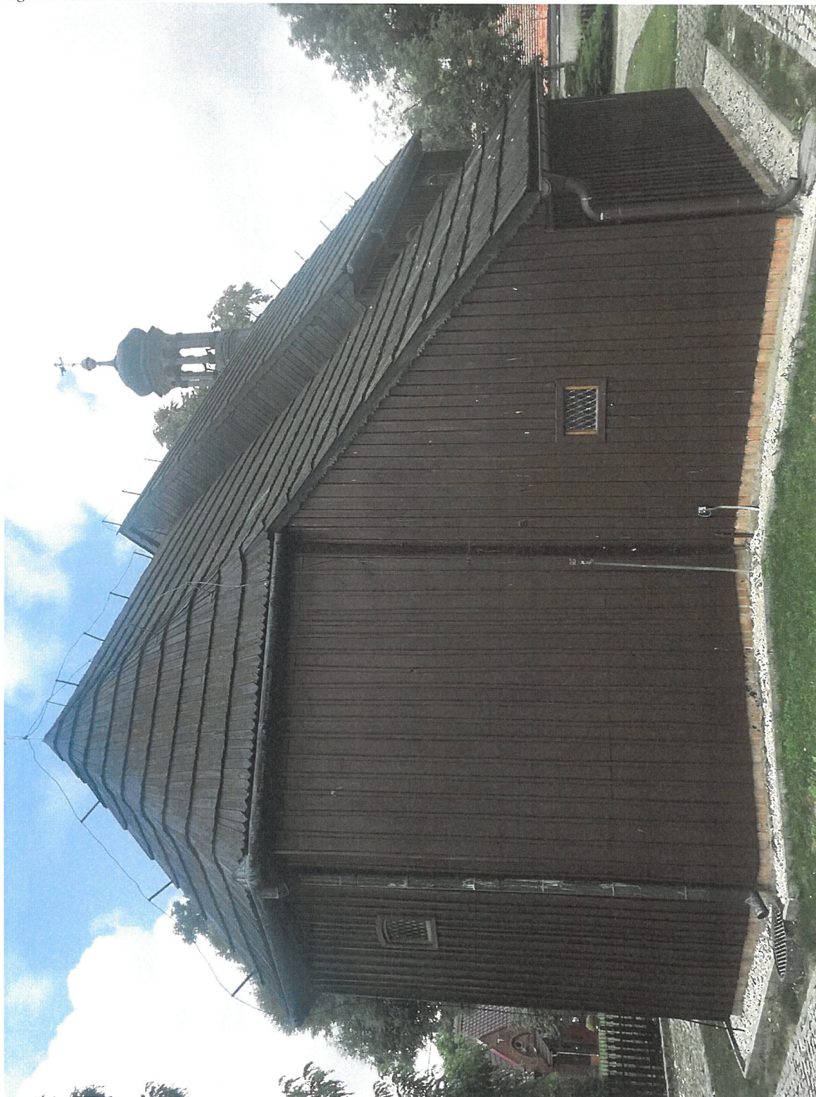
Inwentaryzacja – widok od strony wschodniej